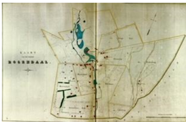
(het kaartboek van Ada Torck uit 1846)

Rozendaal is een bijzondere plaats, met 1600 inwoners, 40 beschermde monumenten en ongeveer 108 bomen per inwoner! Aan de hand van kaarten en oude en nieuwe foto's vertelt Cathrien van de Ree daarover. We starten met de powerpoint bij de kerk en we kijken vooral naar historische plekken in het beekdal. Buiten de dorpskom is veel veranderd, maar ook daar is de geschiedenis nog steeds zichtbaar.