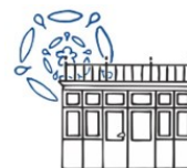
De Serre van Rozendaal

U bent hiervoor van harte uitgenodigd in de Serre van Rozendaal. Vanaf 10 uur staat de koffie klaar en het optreden begint rond 10:30 uur.