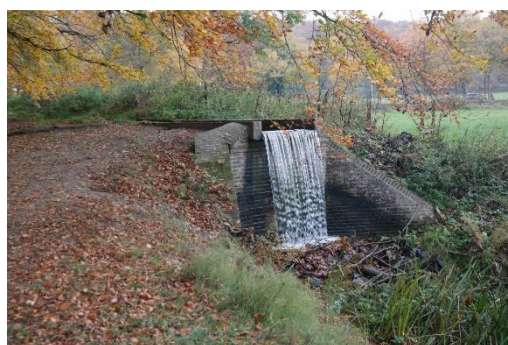
De wandeling duurt ongeveer 2,5 - 3 uur

Nieuwsgierig? Kom dan ook naar de parkeerplaats bij station Velp waar de wandeling om 14.00 uur begint en loop mee met onze gidsen.