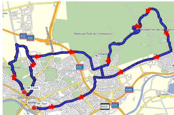
Parcours NK Wielrennen 2024

De drie onderdelen volgen elkaar op: als de beloften de Posbankronde verlaten en de Arnhem ronde opgaan, starten de Dames, etc. Naar verwachting verlaten de laatste rijders de Posbankronde om 16.00 uur.