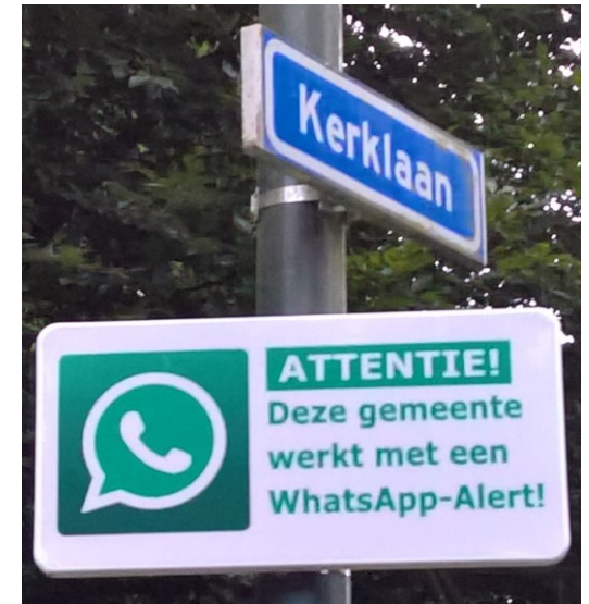
Deze borden zijn aan de randen van Rozendaal geplaatst

Voor het goed functioneren van deze WhatsApp groepen is het noodzakelijk dat alle deelnemers zich gedisciplineerd gedragen als het gaat om inhoud en tijdstip. Soms kan iets wachten tot de volgende dag, soms telt elke minuut. Realiseer je altijd dat er vele deelnemers meelesen. Dus ook graag onnodig 'gebabbel' achterwege laten. De beheerders doen er alles aan om die discipline bij te brengen en te handhaven, maar soms kost het tijd. Vaak zien we direct na 'gebabbel' dat mensen de groep uit ergernis verlaten. De beheerders vragen hier om ieders geduld.