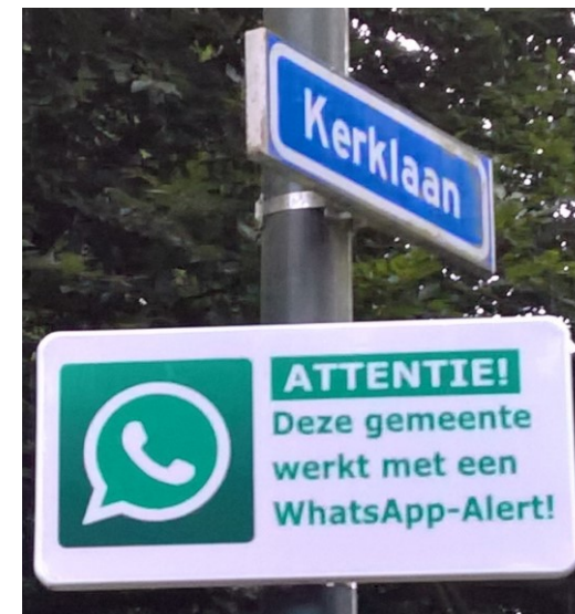
Deze borden zijn aan de randen van Rozendaal geplaatst

Voor het goed functioneren van deze WhatsApp groepen is het noodzakelijk dat alle deelnemers zich gedisciplineerd gedragen als het gaat om inhoud en tijdstip. Soms kan iets wachten tot de volgende dag, soms telt elke minuut. Realiseer je altijd dat er vele deelnemers meeleezen. Dus ook graag onnodig 'gebabbel' achterwege laten. De beheerders doen er alles aan om die discipline bij te brengen en te handhaven, maar soms kost het tijd. Vaak zien we direct na 'gebabbel' dat mensen de groep uit ergernis verlaten. De beheerders vragen hier om ieders geduld.